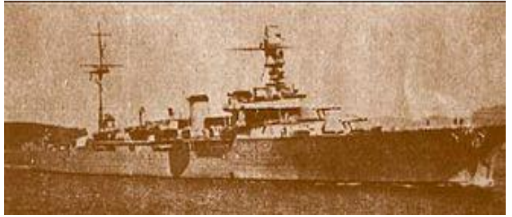
เรือลาม็อต-ปีเก คู่ปรับของกองทัพเรือสยาม