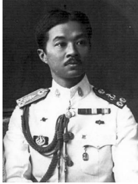
เจ้าฟ้าบริพัตร