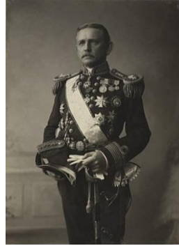
พระยาชลยุทธ