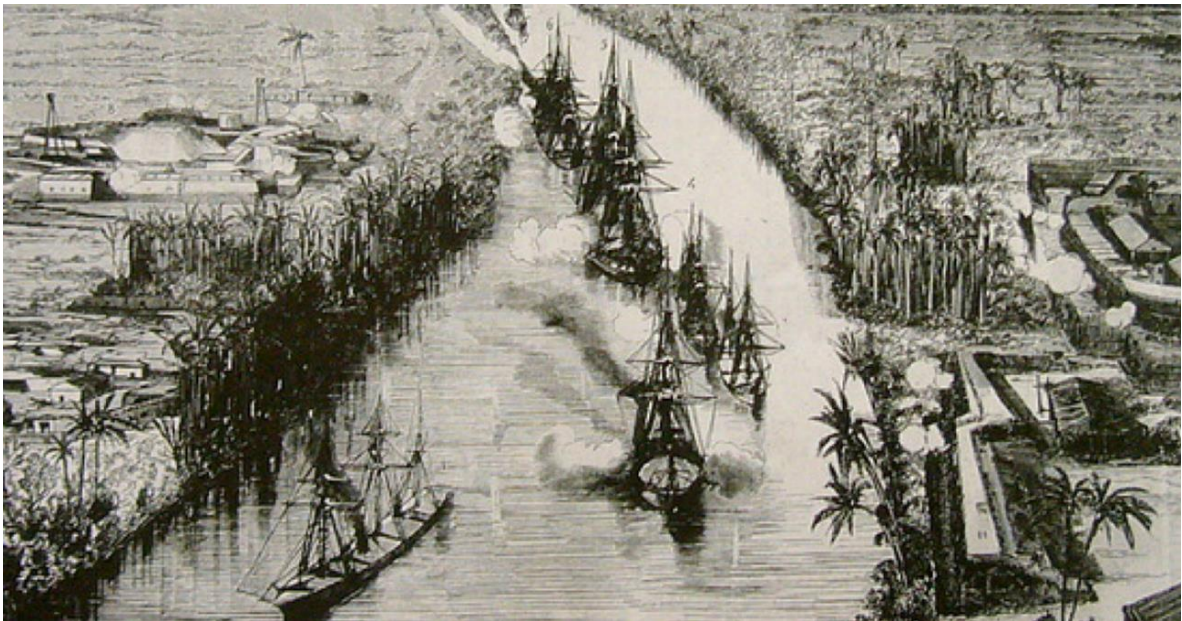
วิกฤตการณ์ ร.ศ. ๑๑๒ (Franco-Siamese War หรือสงครามฝรั่งเศส-สยาม)

- ยุค Pre Modern Navy เป็นยุคที่กองทัพเรือไทยยังไม่ได้อยู่ในสภาพที่มีความเป็นกองทัพเรือ โดยในยุคนี้เป็นยุคที่อาณาจักรสยามยังไม่ได้รับการยอมรับจากอาณานิคมอารยประเทศว่าเป็นรัฐชาติสมัยใหม่ในสังคมระหว่างประเทศ (International society) โดยรัฐชาติสมัยใหม่นั้นจะต้องประกอบด้วย มีรัฐบาลที่มีอำนาจอธิปไตยในพื้นที่ขอบเขตดินแดนที่ชัดเจน มีพลเมืองหรือประชาชน และมีเอกราชที่ได้รับการยอมรับในสังคมระหว่างประเทศ ซึ่งภายหลังสยามประเทศได้รับการยอมรับจากมหาอำนาจโลกในขณะนั้นคือ บริเตนใหญ่ (อังกฤษ) และ ฝรั่งเศส เป็นยุคที่กองทัพเรือกำลังจะเริ่มมีแนวคิดที่จะมีกำลังอำนาจทางทะเลเพื่อปกป้องอาณาจักรสยาม จากการอาณาจักรสยามมีเรือที่ใช้ในแม่น้ำเท่านั้น โดยระเบียบโลกในขณะนั้นอยู่ในระบอบล่าอาณานิคม ประเทศยุโรปต่างมีข้อตกลงร่วมกันที่จะล่าอาณานิคมเพื่อสร้างความมั่งคั่งให้กับประเทศตน แต่จะไม่ละเมิดผลประโยชน์ในอาณานิคมของประเทศอื่น