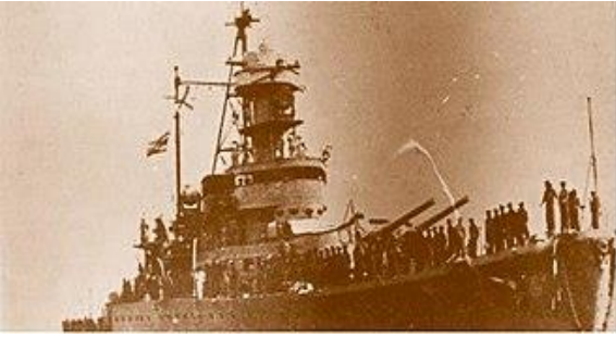
เรือหลวงธนบุรี ก่อนเข้าร่วมยุทธนาวีฯ