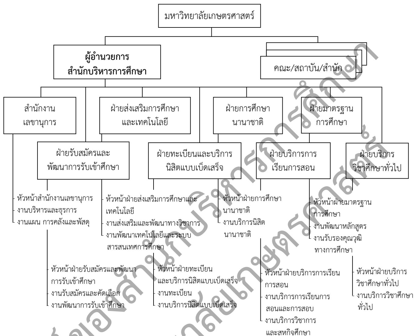
ภาพที่ 1 โครงสร้างการบริหารงานสำนักบริหารการศึกษา