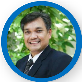
อธิการบดี มก. ประธาน