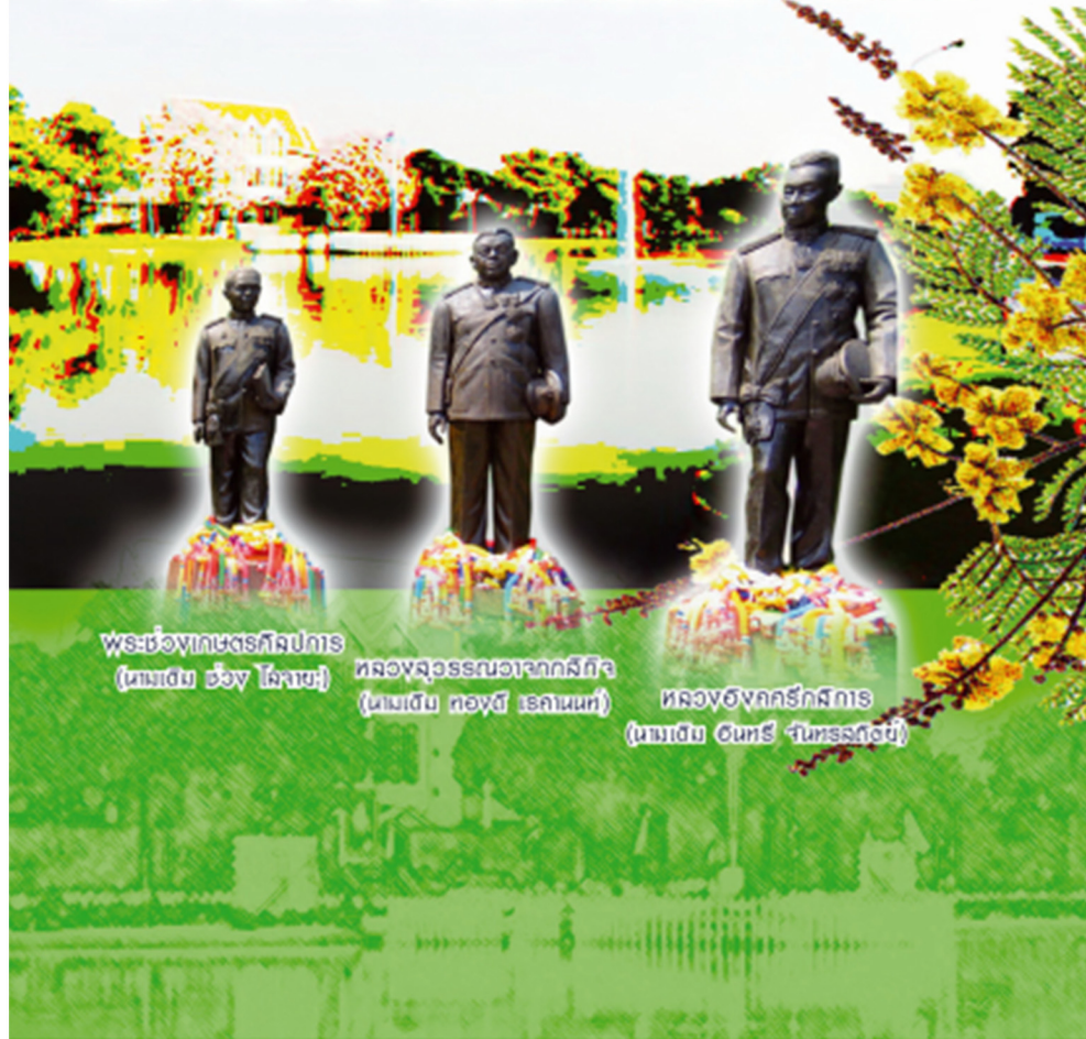
พระชอู่ทศพรทิศปการ (นามเดิม ชอู่ โสภษ)